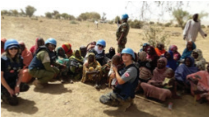
مستشارو الشرطة يتفاعلون مع المجتمع عند اكتمال عملية إعادة الإعمار

فرغ مجتمع طويلة وسكان قرية شكشكو والنازحون من تشييد حائط تحويل مجرى الوادي والذي أكتمل قبل بداية موسم الأمطار ٢٠١٨. أسهم إكمال المشروع في الموعد المحدد في الحد من خطر الفيضان وجدد الامل بالنسبة إلى العائدون إلى قرية شكشكو حيث تحسن الوضع الأمني بفضل الجهود المتواصلة لليوناميد.