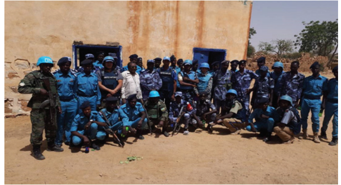
فريق اليوناميد وضباط قوات الشرطة السودانية يتجمعون لأخذ صورة جماعية بعد التدريب UNAMID team and SPF officers pose for group photograph after the training