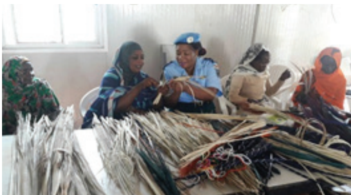
A UNAMID IPO showing one of the women a basketry and weaving technique ضابطات الشرطة المتدربات يشرحن للنساء طرق النسيج

The program covered theories on materials and designs followed by practical demonstration and practice on weaving. The trainees were able to weave impressive handcraft items that included utility baskets, laundry bins, mats and decorative baskets of various shapes, sizes and colors.