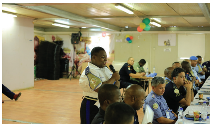
Contingent Commanders also sought clarification on the new mandate

The retreat also reiterated the need for coordination and cooperation with the GOS, including local authorities, UN entities and development actors to work together to stabilize and improve the security situation and assist in the restoration of State authority, which was clearly highlighted in the new mandate.