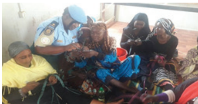
Lecture and demonstration of the weaving techniques

TS also conducted a three-day Bakery training programme for 24 women IDPs from the same IDP Camps in November 2017. Women Network facilitators trained the female IDPs on how to bake bread and in the end of the training gave them ingredients to initiate bakery projects and perfect their skills in their respective IDPs Camps.