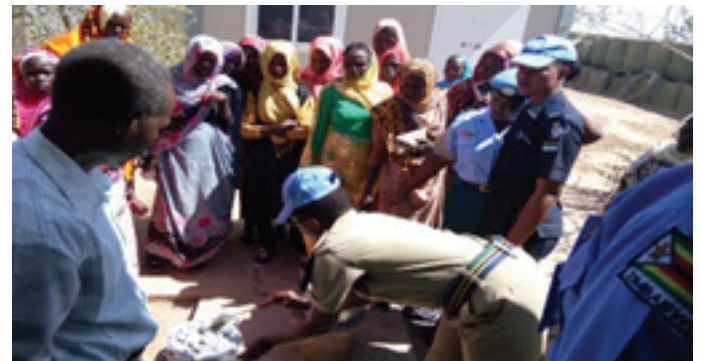
ضابطات شرطة اليوناميد يشركن النازحات في تطوير مهارتهن في مجال الخبز

تعتبر صناعة السلال والنسج فعالة من حيث التكلفة ومشروعاً بأسعار معقولة للنساء كما هو الحال مع المواد الخام الطبيعية مثل القش والخيط والخيزران والعشب التي تتوفر بسهولة داخل المنطقة المحلية. إنها تجارة مربحة للغاية مع سوق كبير في منطقة شنقل طوباية وما وراءها.