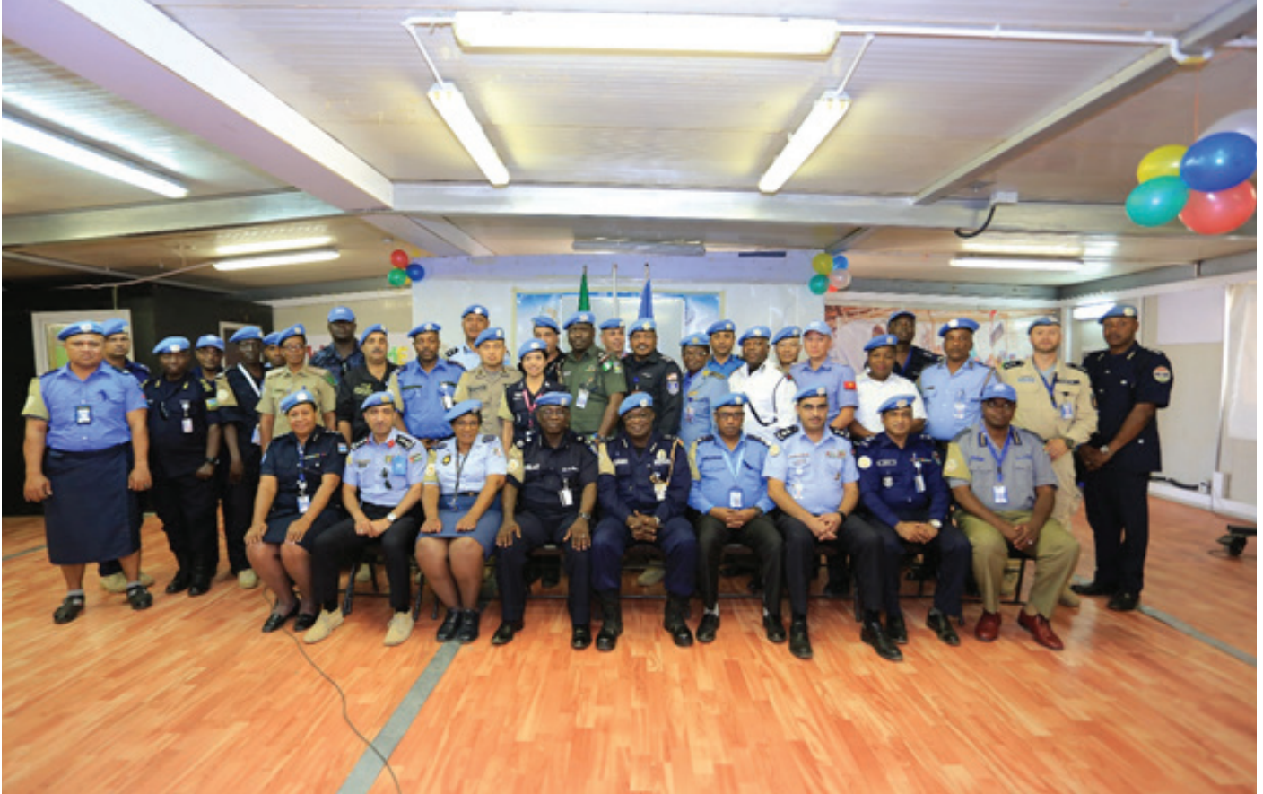
UNAMID SMT in a group photo with Contingent Commanders from various PCCs