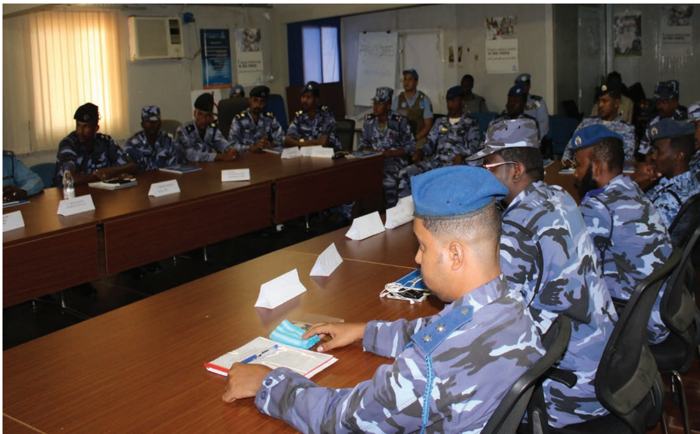
Sudanese Police Force officers undergoing training.