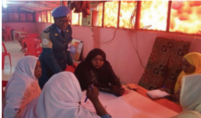
A UNAMID IPO interacting with the women during WNPG workshop