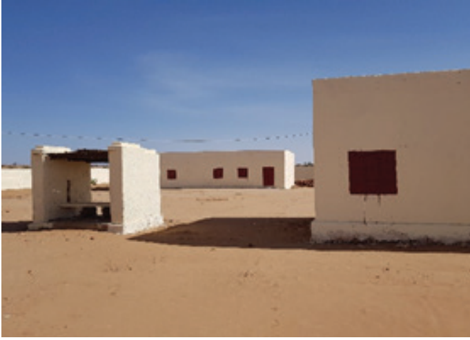
المباني التي تم تأهيلها أعطت المدرسة منظرا جديدا

منظمة لاشن هيلفن الألمانية وهي منظمة غير حكومية في ألمانيا، تم تأسيسها من قبل الجنود والشرطة الألمانية لتقديم المساعدات الإنسانية في مناطق ما بعد الصراع. تعني كلمة «لاشن هيلفن» بالألمانية «ساعد على الضحك» أو إعادة رسم البسمة على شفاة أطفال المناطق المنكوبة حيث تشتعل الحروب.