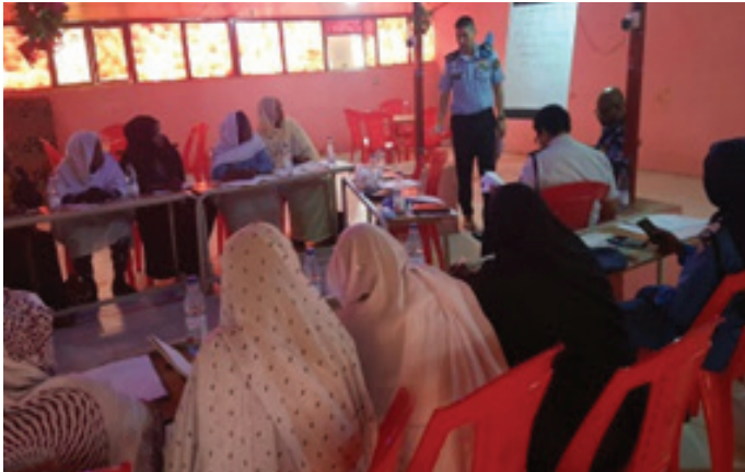
A UNAMID Facilitator making a presentation to the SPF female officers. ميسرو اليوناميد يقدمون عرضاً لضابطات قوات الشرطة السودانية

The participants embarked on brainstorming session to bring out an action plan for the working group to form a committee with focal persons representing each locality to implement protection mechanism for the vulnerable groups. Most of the participants were well versed with the knowledge and understanding of the Women and Children Protection Services having recently completed Twenty-Day Training program on Community and Popular Policing training held at El Fasher in collaboration with SPF and United Nations Development Program (UNDP).