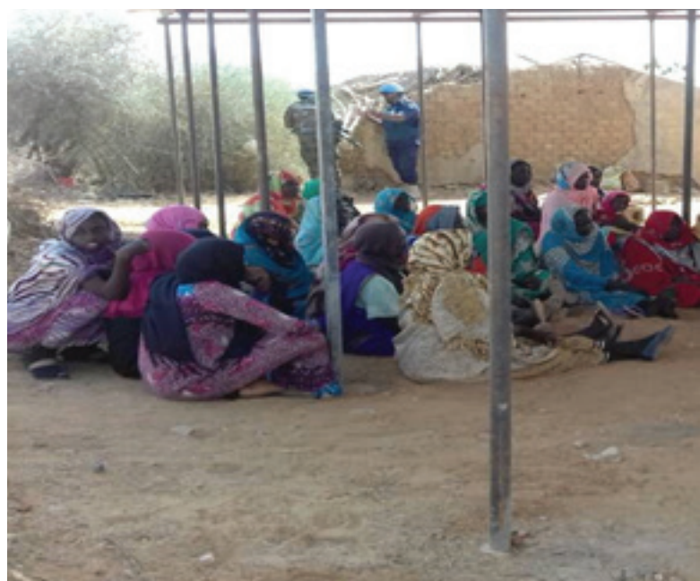
Women community leaders and UNAMID female IPOs during training on CEDAW, CRC and SGBV cases.

Recognizing the threats posed by these vulnerabilities, Kutum TS thus embarked on a training of 38 women community leaders from different localities in and around Fataborno IDPs camp in community policing initiatives, human rights and SGBV.