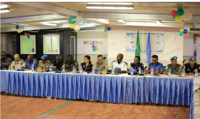
Contingent Commanders during the meeting

فريق القيادة العليا لشرطة اليوناميد يتناول بعض القضايا خلال المعتكف مع قادة الوحدات