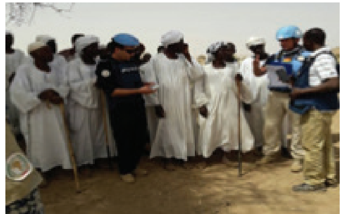
مستشارو الشرطة يتفاعلون مع المجتمع في إعادة تأهيل حائط تحويل مجرى ماء

شارك الموقع الميداني بطويلة في هذا النشاط كجزء من جهودهم المتواصل لخلق بيئة وقاتية للمجتمع وللنازحين. وقد أسهمت عملية إعادة الإعمار مباشرة في رفع آمال العديد من النازحين الذين يرغبون في العودة لقراهم بعد عقود من هجرها.