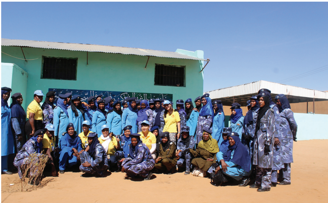
SPF Female Popular and Community Policing officers pose for group photo with UNAMID police facilitators. ضباط وافراد الشرطة الشعبية وموظفي الشرطة المجتمعية خلال التقاط صورة جماعية مع المدربين من شرطة اليوناميد

United Nations Security Council Resolution 1325/2000 on Women, Peace and Security, continues to underpin UNAMID Police Component strategic priority of creating a protective environment. There has been special focus on promoting the role of women in the prevention and resolution of conflicts over the years with a number of advocacy programmes, livelihood skills building trainings, workshops, institutional building and gender mainstreaming activities have been rolled out regardless of the cultural challenges, to enable equal participation of women in the efforts to maintain security and sustain peace and in Darfur.