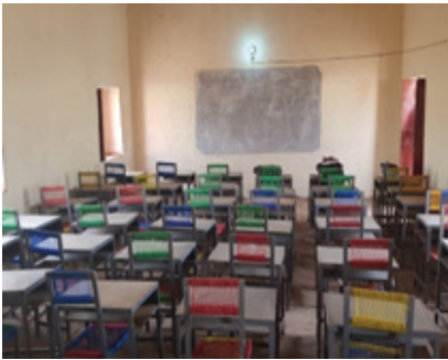
الأثاث الجديد للفصول