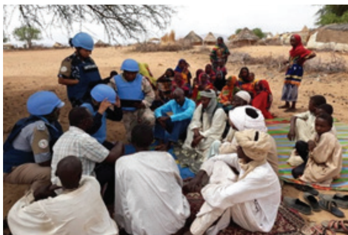
UNAMID IPOs took time to educate IDPs on gender mainstreaming ضابطات شرطة يقمن بتوعية وثقيف النازحين بشأن تعميم مراعاة المنظور الجنساني

Women and girls in some of the local communities still remain vulnerable to specific forms of gender-based violence and they emanate from pre-existing gender discrimination deep rooted in local cultural practices. In the trust to bring meaningful change in the policing framework towards protection of women, UNAMID Police component of Sector North headquarters in collaboration with North Darfur SPF Commissioner office established a Women Network Protection Group (WNPG) under its area of responsibility.