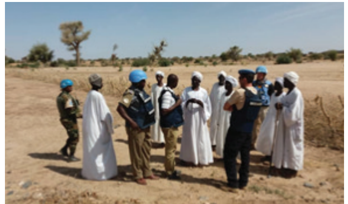
Police Advisors interacts with community on rehabilitation of the Water Diversion Wall

The restoration of the diversion wall has secured water for drinking and irrigation for local communities in Tawilla, Shakshaku and IDPs camps. It has also significantly benefited IDPs from Argo, Dally and Dabanera as well as in mitigating the risk of flooding thereby enabling revival of an old village in Shakshaku which at one time about 600 families.