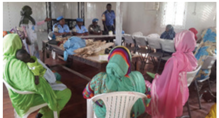
UNAMID IPOs engaging internally displaced women before the training

Self-sufficient and independent women are better placed to come forward and seek protection and justice, which is critical in the fight to end the Sexual and Gender Based Violence (SGBV) in Darfur. Many displaced women continue to face difficulties in finding coherence in the post-conflict societies preoccupied by the fears of violence and the pressure to rebuild their lives while some victims of SGBV felonies struggle through the ordeals of having to live with the horrific experiences every day.