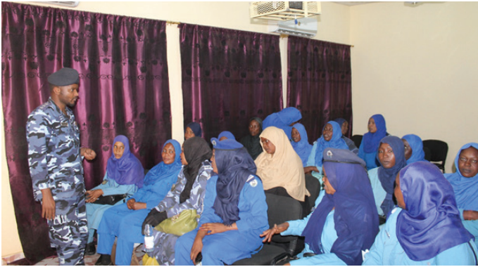
قوات الشرطة السودانية قدمت أيضاً دروساً إلى متدربات الشرطة الشعبية

وكانت الخطة المستهدفة هي تدريب 100 امرأة من الشرطة الشعبية من خلال تنفيذ البرنامج التدريبي الذي استمر لمدة عشرين يوما في مناطق الفاشر ونبالا وزالنجي والجينة في دارفور. تلقت الدفعة الاولى وهي 20 امرأة من الشرطة الشعبية بولاية شمال دارفور تدريباً بمركز التدريب بمقر قوات الشرطة السودانية في الفاشر في الفترة من 21 مايو 2018 إلى 7 يونيو 2018 بينما أكملت المجموعة الاخرى وهي 20 شرطية من ولاية غرب دارفور تدريبها في 6 يونيو 2018. حضرت السيدة بريسيليا ماكوتوز، مفضة شرطة اليوناميد، يرافقتها وفد من فريق الادارة العليا الاحتفال الختامي للفعالتين في كل من الجينة والفاشر. وقالت في كلمتها إن التقدم المحرز عبر تدريب 100 شرطية من مختلف أنحاء دارفور كان أساسيا في تعزيز الحماية المجتمعية للسكان الاضعف ودعت إلى المساواة بين الجنسين في عمل الشرطة في ضوء تعزيز الوعي والدعم لضحايا العنف المنزلي والاستجابة للعنف الجنسي والعنف القائم على نوع الجنس الاجتماعي وجرائم العنف الجنسي المرتبط الصراع.