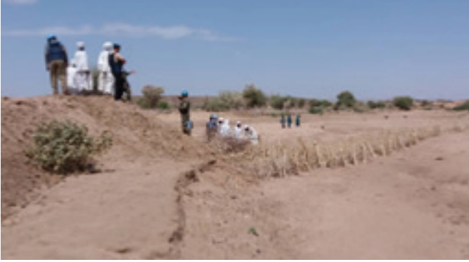
Police Advisors visit the site of construction