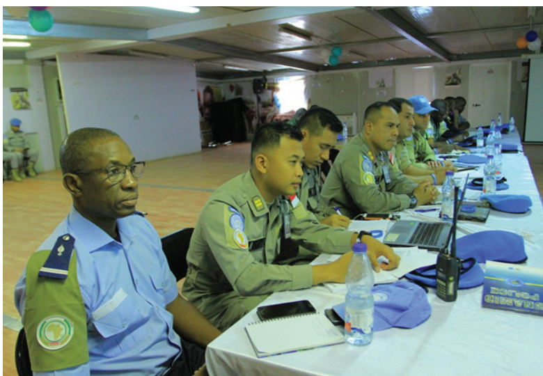
Some FPU Commanders during the meeting at ARC Town Hall

كروز سانتوس يتقرب من الشرطة مفوضة خدمته الذي التويز عقب الوحدات قادة