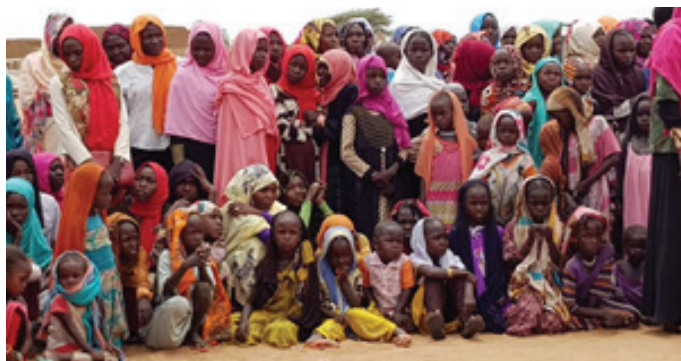
Children from the community could not miss the historic event.