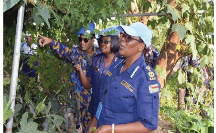
قادة وحدة الشرطة المشكلة يعرض لمفوض شرطة اليوناميد نبات القرع المر والمنتج داخل الوحدة.

Everyone loves to stay in a clean and green environment but only few people make the efforts to take action to maintain a clean and pollution free environment. Gardening has numerous benefits as it is a source of fresh and organic foods, supplements family budgets, makes good use of space and protects soil and acts as a source of entertainment, fulfilment and creativity and it is at the backdrop of these that, at the very outset of BANFPU's arrival in Nyala super camp, BANFPU contingent members started the clean and green campaign by cleaning up the yellow and weedy compound.