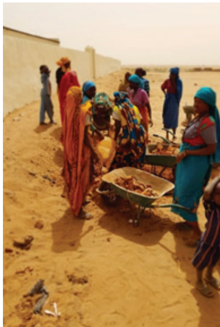
أفراد المجتمع يساهمون في العمل لإعادة بناء المدرسة