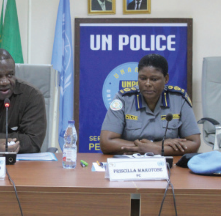
في ١٧ يوليو ٢٠١٨، واصلت القيادة العليا لشرطة اليوناميد اجتماعها مع قادة وحدات الشرطة المشكلة في قاعة المؤتمرات في (SPF)

اعتمد مجلس الأمن التابع للأمم المتحدة القرار رقم ٢٤٢٩ (٢٠١٨) في ١٣ يوليو ٢٠١٨ حيث مدد تفويض اليوناميد حتى ٣٠ يونيو ٢٠٢٠. يؤكد التفويض الجديد على دعمه المتواصل لليوناميد لبناء نهج ذات شقين كما ورد في القرار القديم رقم ٢٣٦٣ (٢٠١٧) ويستند القرار على تقرير الأمين العام ورئيس الاتحاد الأفريقي اللذين قدما نهجاً متكاملًا لدارفور. ويشمل المفهوم الجديد للبعثة تعديل الأولويات الخاصة باليوناميد بالإضافة إلى مفهوم الانتقال بالتعاون مع الفريق القطري للأمم المتحدة خلال إطار زمني يمتد لعامين مع التركيز على خروج البعثة بحلول ٣٠ يونيو ٢٠٢٠ والتصفية بنهاية ديسمبر ٢٠٢٠.