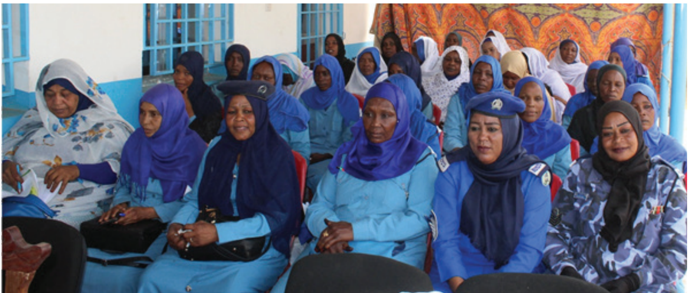
Part of the SPF Female Popular Police Trainees