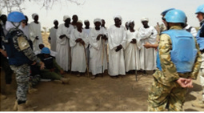
مستشارو الشرطة يتفاعلون مع المجتمع عند اكتمال عملية إعادة الإعمار

أثبتت عمليات حفظ السلام بانها أحد ادوات الفاعلة المتاحة للأمم المتحدة لمساعدة الدول المضيفة للمضي عبر الطريق الشاق للصراع والوصول إلى السلام. مع تقدم عملية بناء السلام في كل عملية لحفظ السلام، يتوجب على حفظة السلام تحمل عبء إعادة التأهيل مع المجتمعات المحلية. في الواقع، يمكن أن نجعل الحياة أكثر سهولة لألف الناس من خلال اعمال إنسانية بسيطة.