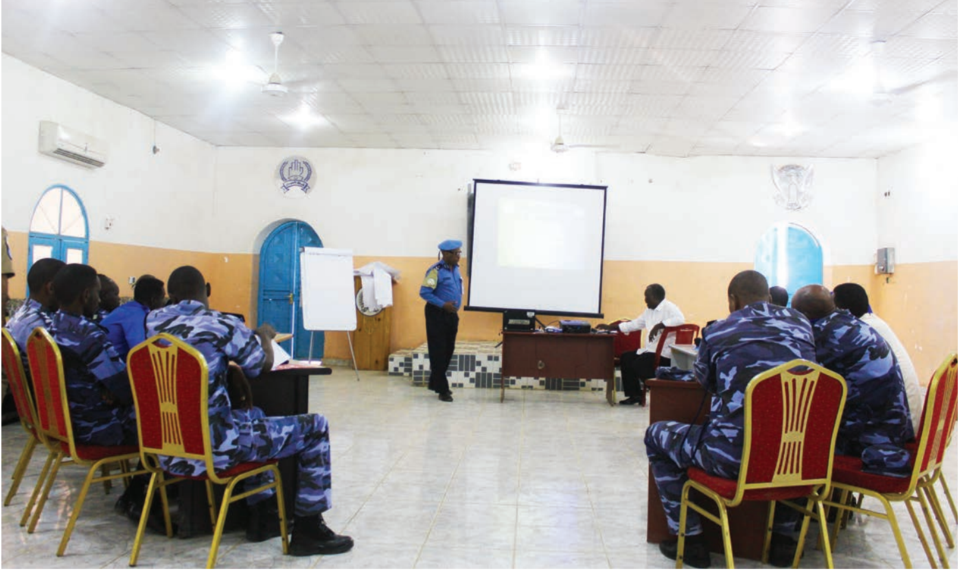
SPF officers during a training delivery.