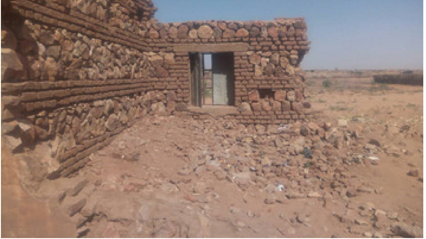
Decrepit walls had characterized classrooms in Tawilla Secondary School.