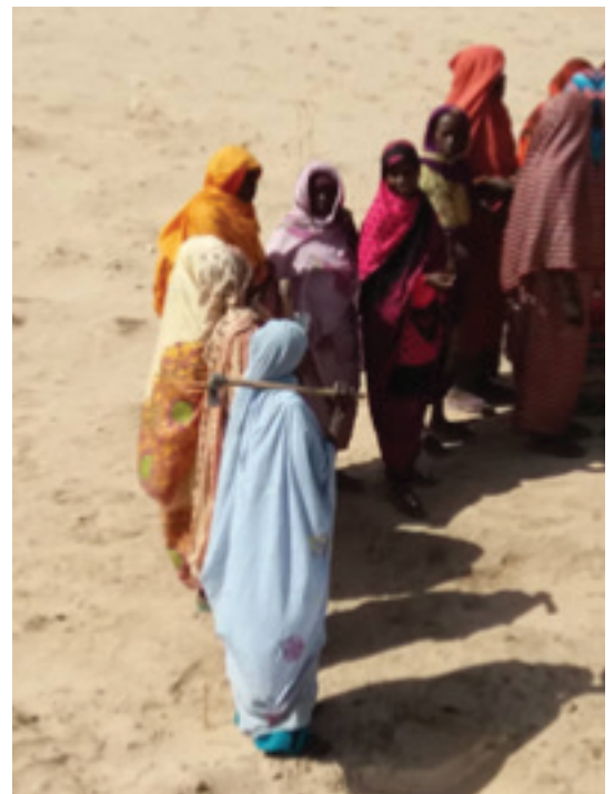
Tawilla Community at Rehabilitation of Water Diversion Wall

مستشارو الشرطة يتفاعلون مع المجتمع في إعادة تأهيل حائط تحويل مجرى ماء