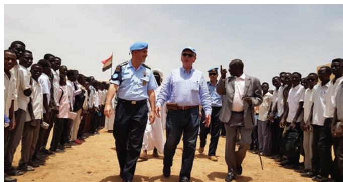
ASG and POLAD arriving to a loud cheering from Tawilla Secondary School boys. وصول مساعد الأمين العام والمستشار الشرطي وسط هتاف من أولاد مدرسة الطويلة الثانوية