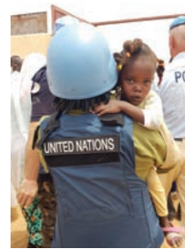
UNAMID IPO showing love to the heart of a child during handover of a refurbished secondary school for boys in Tawilla.

شرطة اليوناميد تظهر الحنان لطفل أثناء تسليم المدرسة الأساسية للبنين بعد التجديد في محلية طويلة