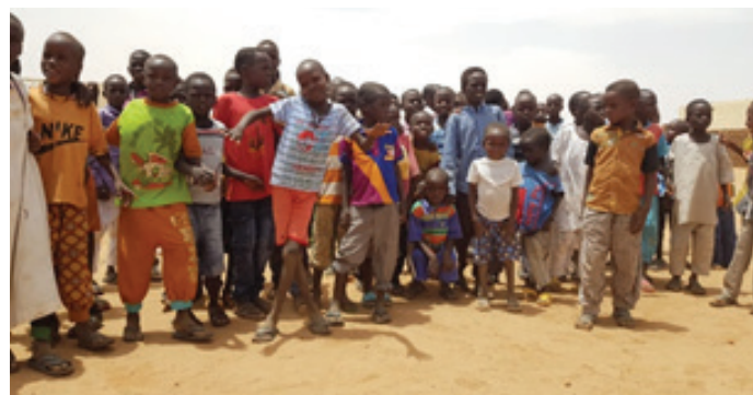
لا يمكن للأطفال المجتمع تفويت مثل هذا الحدث التاريخي.