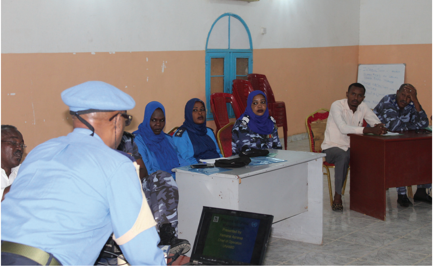
A Senior UNAMID Police Officer delivering a lecture to SPF female Popular and Community Policing officer