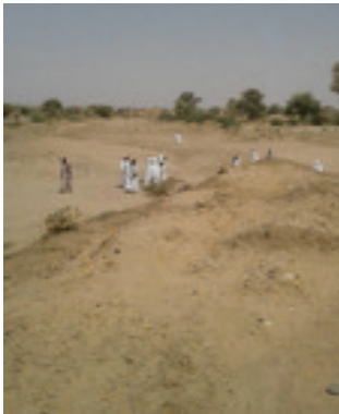
المجتمع في حالة عمل Community at work

As a part of their ongoing efforts to create protective environment for the community and Internally Displaced Persons (IDPs) UNAMID Tawilla Team Site is engaged in community supporting activities. Its facilitation of rehabilitation of the diversion dam wall recently contributed directly and immensely to uplifting the hopes of many IDPs some of whom have since returned to their villages after being displaced for over a decade.