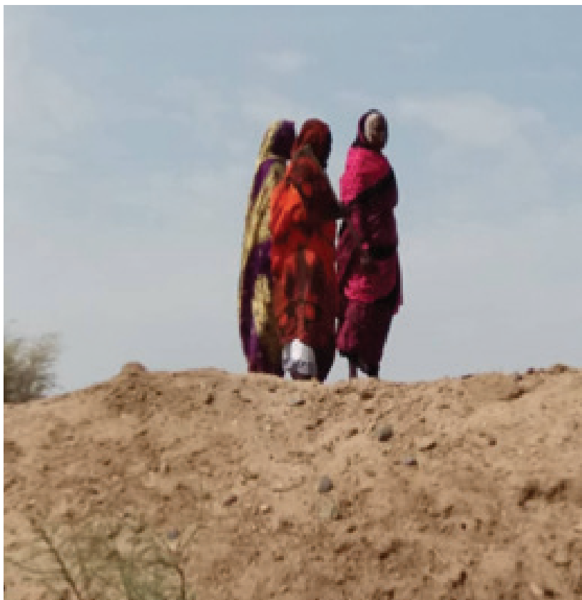
Some Tawilla Community women standing at the crest of the diversion wall

مجتمع طويلة أثناء إعادة إعمار حائط تحويل الماء