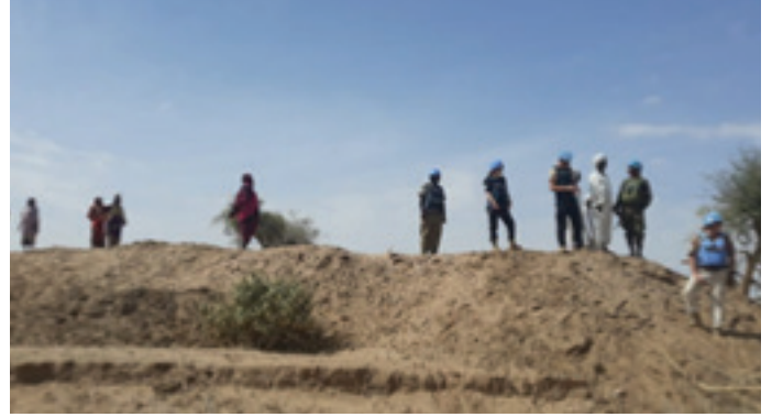
مستشارو الشرطة يزورون موقع البناء

كجزء من جهودهم الحثيثة لخلق بيئة آمنة للمجتمع المحلي والنازحين ، شاركت الفريق الميداني لليوناميد في طويلة في الانشطة الداعمة للمجتمعات. أسهمت مشاركته في إعادة تأهيل حائط تحويل مجرى الوادي بشكل مباشر في تنامي آمال العديد من النازحين الذين عادوا إلى قراهم بعد هجرها لعقد من الزمان . عبر مجتمع طويلة، عبر قاداته، عن بالغ امتنانه لكرم ضباط الشرطة المنتدبون والذي تجسد في اهتمام ورعايتهم للناس الذين وجدوا أنفسهم في أوضاع ما بعد الصراع . وقال العمدة، إنه موقف يستحق أكثر من الثناء وقد أثلج صدورنا ان نرى شرطة اليوناميد وهي تقدم مساهمات شخصية لمساعدة المحتاجين وتحسين حياة الناس في طويلة. يقع معسكر موقع طويلة الميداني على بعد ٨٠ كلم شمالي الفاشر ويعيش بالقرب منه حوالي ٢٥ ألف نازح مقسمين على خمسة معسكرات للنازحين هي رواندا وأرقو ودالي ودابانيرا ورواندا الجديدة. وهناك ١٠ مناطق عودة بالمحلية