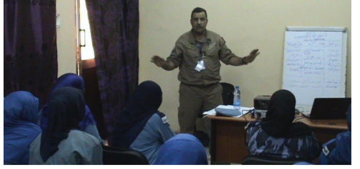
مستشارو شرطة اليوناميد أثناء تدريبهم نساء من الشرطة الشعبية في قوات الشرطة السودانية حول عمل الشرطة المجتمعية UNAMID Police Advisors train Female Popular Police Officers of SPF on Community Policing

من المتوقع أن يفتح هذا الجهد فرصة لتمكين الشرطيات من القيام بالمهام التي يقوم بها زملائهن من الرجال، إضافة إلى العمل على مناصرة تمكين المرأة والمساعدة على زيادة فرص وصول النساء والأطفال المعرضين للخطر إلى العدالة. وهدف التدريب أيضاً إلى تعزيز مؤسسات سيادة القانون لتمكينها من تحقيق السلام والأمن والتنمية في دارفور من خلال تحسين درجة المساءلة لدى هذه المؤسسات.