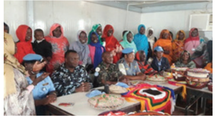
UNAMID Team cutting one of the cakes baked by IDPs trainees

فريق اليوناميد يقطع كعكة من صنع المتدربات