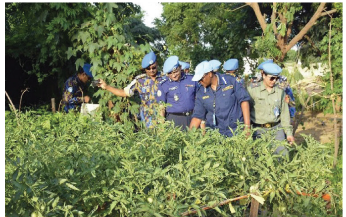
مفوض شرطة اليوناميد خلال التفحص والاعجاب بنباتات الطماطم المزدهرة UNAMID PC admiring flourishing tomato plants.

The clean and green commitment shown through the daily weeding, watering, trellising, mulching and harvesting is a great way to augment an exercise regimen and is commendable and worth emulating. The joy of being greeted by nature daily is enough fulfilment for the contingent. With environment care at the heart of UNAMID, BANFPU exhibited this partnership by inspiring both UNAMID staff and the people of Darfur to improve their quality of life without compromising that future generations through caring for the environment as peace is directly linked with nature. Green is wealth.