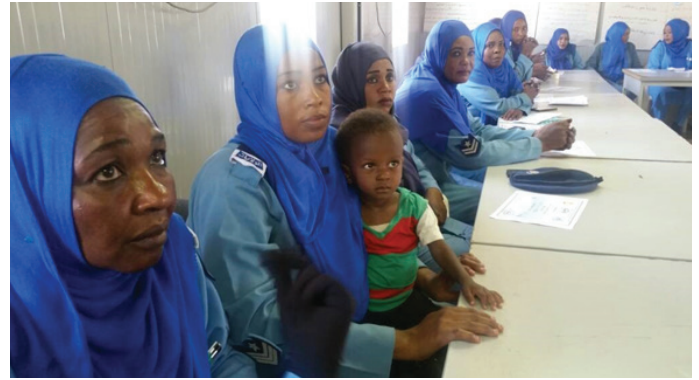
نساء من الشرطة الشعبية يحضرن دورة تدريبية حول الشرطة المجتمعية في نبالا

SPF also delivered lessons to the Female Popular Police trainees.