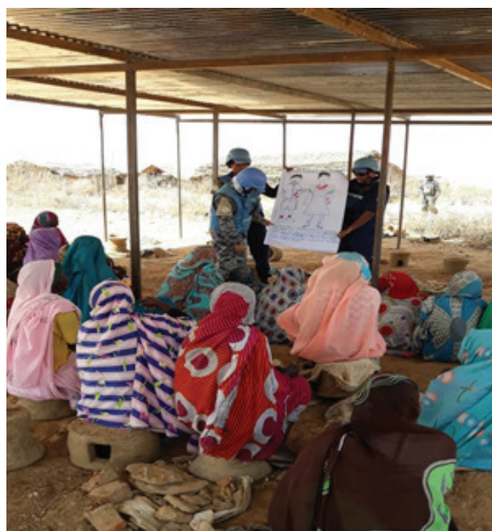
UNAMID IPOs illustrating some key points during the training.

ضابطة شرطة معارة ناطقة بالعربية تجري تدريباً للنساء