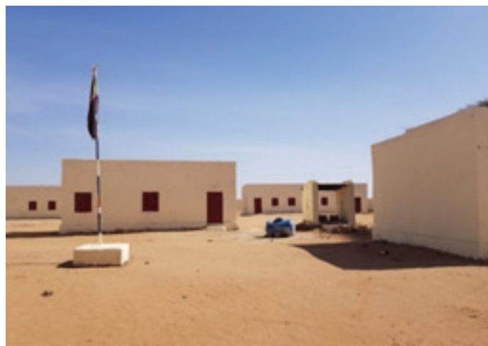
Refurbished buildings gave the school a fresh outlook.

In her address, the Minister of Education said the "school was a symbol of peace and the contribution was an evidence of UNAMID's relentless effort to help the people bring peace in Darfur". She emphasized on the importance of education for the vulnerable children urging the parents and the teachers to put the facilities to best use.