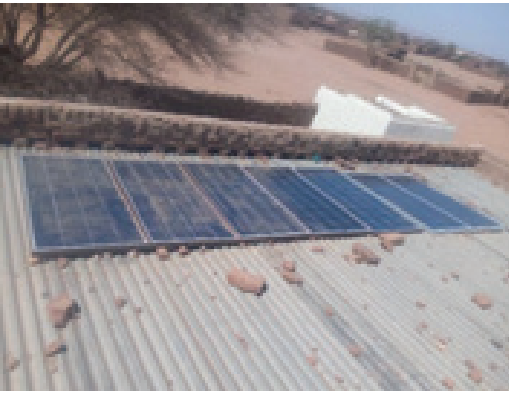
الحواسيب المحمولة وألواح الطاقة الشمسية المهداة من شرطة اليوناميد للمدرسة

تميّز الاحتفال الذي نظمه المجتمع ومعتمد المحلية بتفرد الرقصات الشعبية لنساء طويلة .