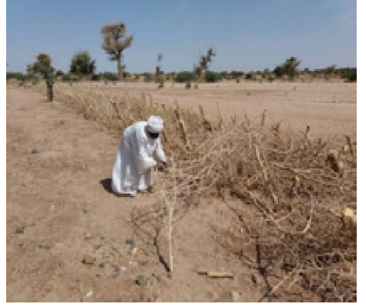
Community at work

Police Advisors with male community members upon the completion of reconstruction of the dam.