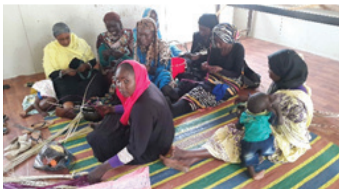
Internally displaced women showed a lot of commitment to learn the new skills