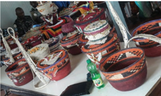
Finished products made by the IDPs trainees