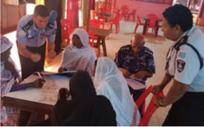
UNAMID Facilitators and SPF female officers in a discussion on how to enhance women participation.

ميسرو اليوناميد وضابطات قوات الشرطة السودانية خلال مناقشة كيفية تعزيز مشاركة النساء