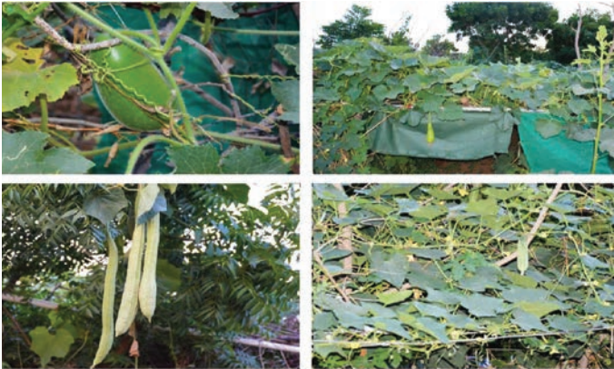
يشكل القرع والخيار والقرع الشمعي أو القرع المسطح أكبر جزء من البيئة الخضراء النظيفة

Within a week of cleaning the compound, the next task was to make it green. The contingent identified different plots of lands at the periphery of their camp for cultivation. The land though rough with stones and sand, was ploughed by the contingent members with local tools to make the soil fertile. The land was then irrigated and mixed with composite fertilizer to make it ready for use. Bangladeshi FPU personnel exhibited innovation and experience by making compost fertilizer out of the separated weeds and grasses gathered and buried in the soil during the land preparation. The soil was then watered daily to help decomposition of the weeds and grass which turned into manure after some days.