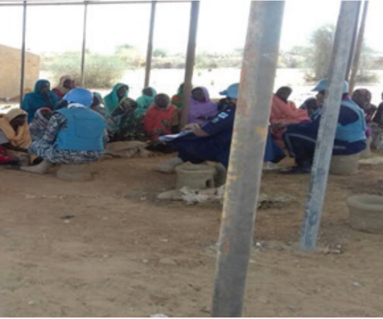
شرطيات تابعات لقوات حفظة السلام يتفاعلهن مع قيادات المرأة المحلية حول اتفاقية القضاء على جميع أشكال التمييز ضد المرأة (سيداو) واتفاقية حقوق الطفل والعنف القائم على الجنس والنوع الاجتماعي