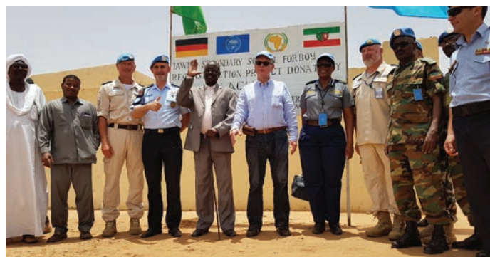
ASG, POLAD pose for a photo with UNAMID PC and Tawilla local leadership. مساعد الأمين العام و المستشار الشرطي مع مفوض شرطة اليوناميد وقادة المجتمع المحلي في طويلة