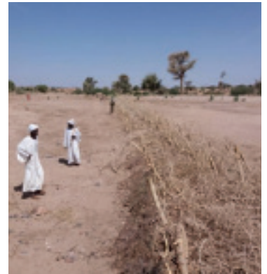
المجتمع في حالة عمل Community at work

"It is more than praiseworthy and touches our hearts to see UNAMID Police making personal contributions to help the needy and improve the lives of the people in Tawilla," the UMDA said.