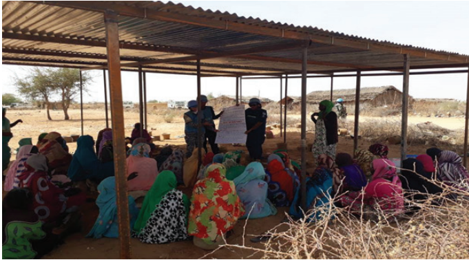
تلقت قيادات المرأة في فتابرنو دورة تدريبية في الشرطة المجتمعية وحقوق الإنسان Fataborno Community Women leaders receiving training.

وتركز جميع برامج التدريب التي نظمها المكون الشرطي في مواقع الفرق الميدانية في جميع أنحاء دارفور على بناء مجتمعات أقوى تستطيع تنسيق وإدارة قضايا السلامة والأمن الخاصة بها بالتنسيق مع الشرطة المحلية. وتوجه الجهود المكثفة لهذه المكونات نحو ضمان بيئة مواتية للحماية حتى لا ترتكب جريمة خطيرة في المجتمعات. وبالفعل لا يمكن تحقيق مثل هذه المبادرات دون إهتمام وتعاون ضباط شرطة فتابرنو إن التعاون المستمر لصالح مفهوم الشرطة الشعبية المجتمعية وإنزاله على مستوى القواعد يعلن عن ظهور رجال شرطة ثابتين في دارفور.