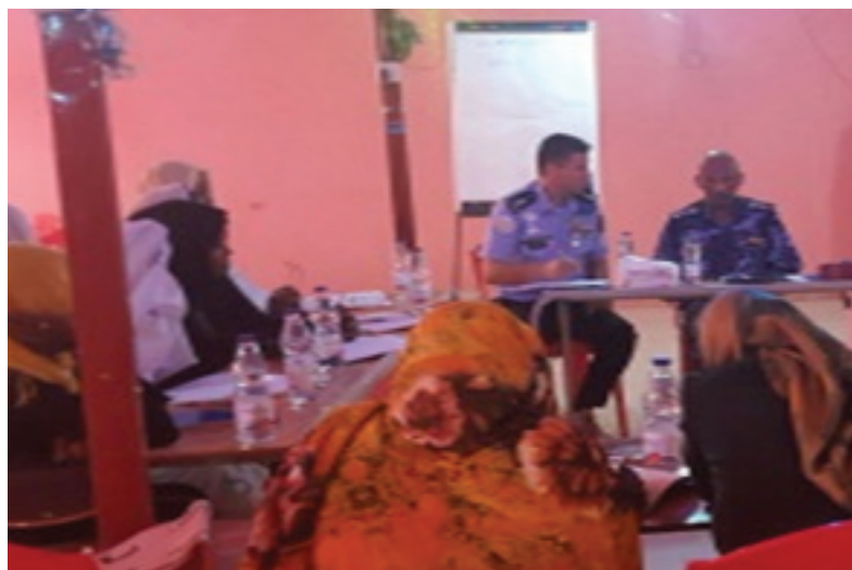
WNPG workshop in El Fasher.

Recently, the Police component in collaboration with Sudanese Police Force (SPF) established Family and Child Protection Centers (FCPC) with its units in various areas in North Darfur. The components engagement with the host-state police extend to advocating for adoption of gender-sensitive