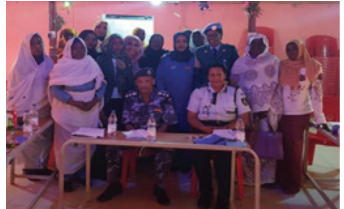
Participants of SPF WNPG with UNAMID Facilitators

التمييز القائم على نوع الجنس الموجود سلفًا والمتجذر في الثقافة المحلية. وفي إطار الثقة بتحقيق تغيير حقيقي في عمل الشرطة الرامي لحماية المرأة، قامت شرطة اليوناميد بالمقر الرئيس بقطاع الشمالي بالتعاون مع مكتب مغوض قوات الشرطة السودانية بشمال دارفور بإنشاء مجموعة حماية الشبكة النسائية في مناطق مسؤوليتها. وتتجسد هذه المبادرة حول إحداث تغيير هادف في آليات الحماية والإصلاح على مستوى الجذور لتعزيز حماية النساء من العنف والوقاية من النزاع ومشاركتهم في صنع القرار وفي عملية السلام بناء على الركائز الأساسية لقرار مجلس الأمن ٢٠٠٠/١٣٢٥. أشركت شرطة اليوناميد قوات الشرطة السودانية في التشاور من خلال لجان تطوير الشرطة على مستوى السياسات والمجتمعات الأمنية المختلفة بما في ذلك التفاعلات والدعوة والتدريب والتوجيه وورش العمل والسمنات لتمكين نقل مسؤولية السلامة والأمن بشكل سلس إلى شرطة الولاية المضيفة. بالتزامن مع هذه الروح، وضعت المبادئ الأساسية لمبادرة مجموعة حماية الشبكة النسائية في ٨ يونيو ٢٠١٨ خلال الندوة التي عقدت بعنوان «مجموعة الشرطة المجتمعية لحماية النساء بقوات الشرطة السودانية في الفاشر».