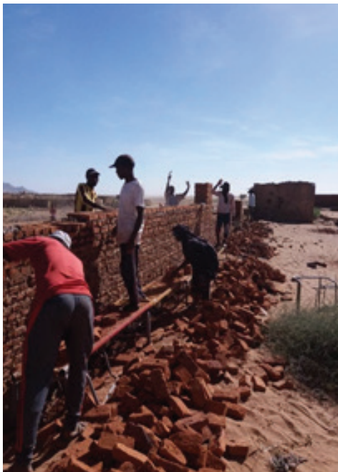
Community members rebuilding the school.

قام مكون الشرطة بطويلة بإعادة تأهيل المدرسة الثانوية الوحيدة للبنين بالمنطقة حيث كانت في حالة يرثى لها بعد سنوات من الصراع. أعادت المنشآت المدرسية الجديدة أمل آلاف من المواطنين بالسالم والتقدم كما وجددت ثقة وإيمان أهالي طويلة باليوناميد.