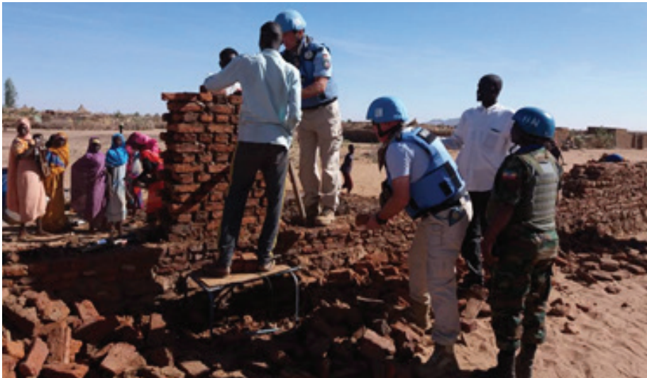
UNAMID IPOs also took part in the rebuilding of the school.

U NAMID Police Component in Tawilla Team Site in Sector North refurbished the community's only Secondary School for Boys, which had remained in dilapidated condition following years of raging conflict. With bullets perforations and no roof tops, what remained of classrooms walls stood precariously close to collapse, a grim reminder of the carnage that once grappled the land.