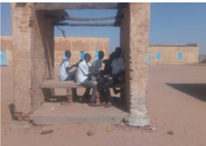
Students used to find shelter under such unsafe school structures يلتجئ الطالب تحت هيكل مدرسي غير آمن

"Lachen Helfen" in German means "help to laugh" or to bring back smiles to children in war and crisis stricken areas is an NGO founded by soldiers and policemen in German for humanitarian assistance in post conflict areas.