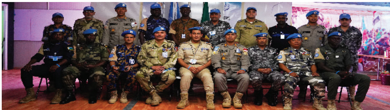
A group photo of FPUs Commanders.