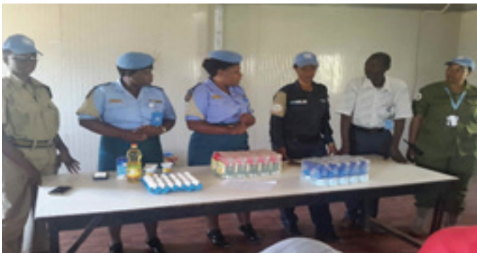
UNAMID IPOs preparing ingredients for IDP women during a bakery skills enhancement training.

وترتبط معظم تلك الحالات بعدم المساواة في النوع الاجتماعي والسلطة وتفشي مناخ الافلات من العقاب والضعف الاقتصادي. وهي متجذرة في ثقافة وعقلية المجتمع مما يضع المجتمع الهش في وضع الحرمان إلى حد كبير. مع ذلك، واصل المكون الشرطي بالبعثة من خلال برامج التوعية المكثفة المدعومة بتنمية مهارات العيش لوضع المرأة في بيئة تمكنها من حماية أنفسهن. وكجزء من الجهد المستمر لتمكين تلك النسوة، نظمت ضابطات شرطة اليوناميد في موقع الفريق الميداني في شنقل طوباية برنامج تدريبي لثلاث أيام اربع وثلاثون نازحة من معسكرات نيفاشا وشداد وأم ضريساوي وقرية شنقل طوباية القديمة في صناعة السلال والثياب والمشغولات اليدوية. اشتمل البرنامج على الجانب النظري واعقبه شرح عملي عن النسيج. تمكنت المتدربات من نسخ مشغولات يدوية مثيرة للأعجاب شملت سلال التسوق والغسيل والحصائر وسلال مزركشة متعددة الاشكال والمقاسات والالوان. غطى البرنامج نظريات حول المواد والتصاميم تليها مظاهر عملية وممارسة على النسيج. كان المتدربون قادرين على نسخ مواد يدوية مثيرة للأعجاب تضم سلال المنفعة وصناديق الغسيل والحصائر والسلال المزخرفة بمختلف الاشكال والاحجام والالوان.