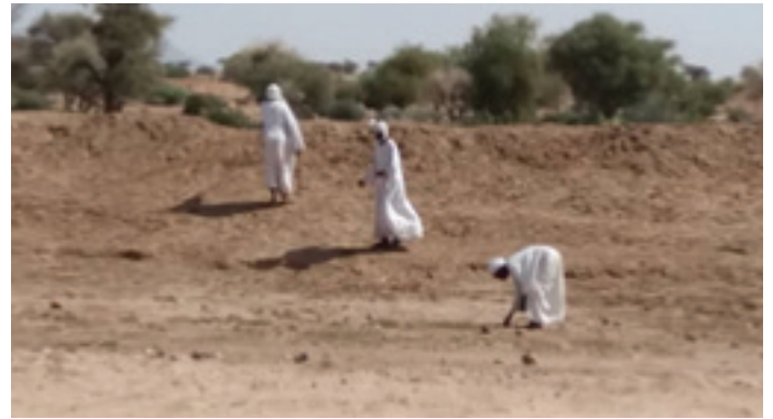
Community at work

كجزء من جهودهم الحثيثة لخلق بيئة آمنة للمجتمع المحلي والنازحين ، شاركت الفريق الميداني لليوناميد في طويلة في الانشطة الداعمة للمجتمعات. أسهمت مشاركته في إعادة تأهيل حائط تحويل مجرى الوادي بشكل مباشر في تنامي آمال العديد من النازحين الذين عادوا إلى قراهم بعد هجرها لعقد من الزمان . عبر مجتمع طويلة، عبر قاداته، عن بالغ امتنانه لكرم ضباط الشرطة المنتدبون والذي تجسد في اهتمام ورعايتهم للناس الذين وجدوا أنفسهم في أوضاع ما بعد الصراع . وقال العمدة، إنه موقف يستحق أكثر من الثناء وقد أثلج صدورنا ان نرى شرطة اليوناميد وهي تقدم مساهمات شخصية لمساعدة المحتاجين وتحسين حياة الناس في طويلة. يقع معسكر موقع طويلة الميداني على بعد ٨٠ كلم شمالي الفاشر ويعيش بالقرب منه حوالي ٢٥ ألف نازح مقسمين على خمسة معسكرات للنازحين هي رواندا وأرقو ودالي ودابانيرا ورواندا الجديدة. وهناك ١٠ مناطق عودة بالمحلية